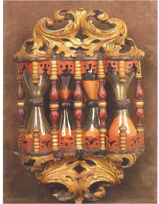
Abb. 3: Kanzeluhr 2. Hälfte 17. Jahrhundert, 42 cm