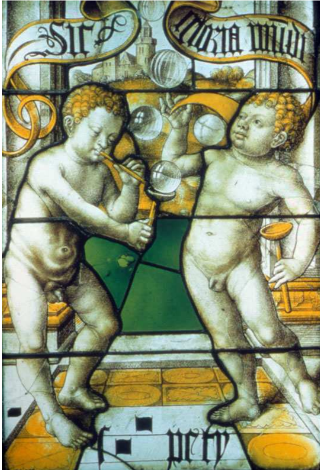
Abb. 1: Zwei seifenblasende Knaben, Glasfenster, Köln, um 1530