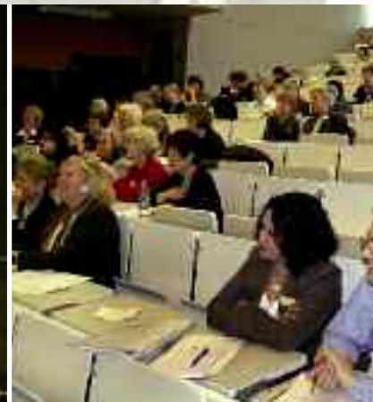
Das Auditorium in der Humboldt-Universität zu Berlin.

herrscht der Eindruck vor, nur als 'halbe' Person zu agieren und sich weder in dem einen noch in dem anderen Bereich voll entfalten zu können. Frauen leiden erwiesenermaßen besonders stark unter ihrem hohen Selbstanspruch. Aber auch Männer stellten laut Harald Schmidt unter Doppelbelastung fest, dass der einzige Augenblick, den sie für sich hätten, die Rasur sei. Dieser Fortbildungskongress solle schon gestandenen Frauen im Lehrerberuf bzw. junge Kolleginnen und Einsteiger motivieren, den Alltag zu bewältigen, sich einzubringen, Beruf und Familie zu mana-